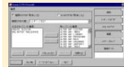
NetWare5 アドミニストレータ・コンソール画面 NDSに統合されたOracleユーザ権限の定義