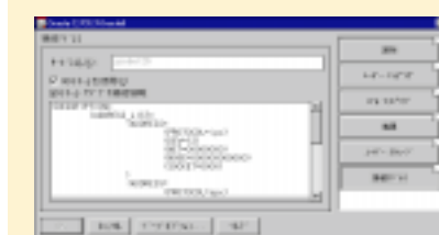
NetWare5 アドミニストレータ・コンソール画面 NDSへのOracle接続構成の設定